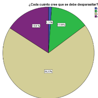
Gráfico 1: ¿Cada cuánto cree que se debe desparasitar?