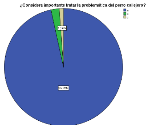
Gráfico 4: ¿Considera importante tratar la problemática del perro callejero?

En la localidad se han desarrollado en los últimos años actividades de difusión como charlas y campañas tomando como temática la tenencia responsable de mascotas, se realizan además campañas municipales de castración y vacunación masivas.